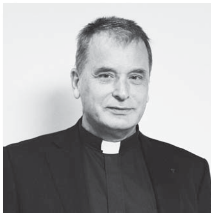
南山大学長 ミカエル・カルマノ